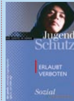
Jugendschutzflyer für Jugendliche