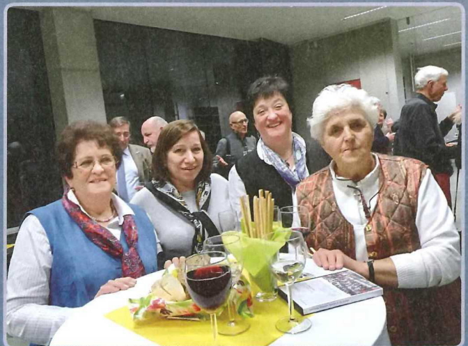
Südtiroler Zeitzeugen aus Salzburg