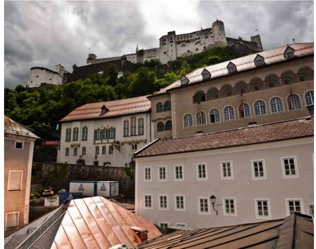
Häuser am Hang des Festungsbergers / Houses on the hillside of the Fortress

1846 zog die Kleinkinder-Bewerhanstalt „Mariano Fridericanum“ in das Gebäude ein, das sechs Jahre später der Verein der Anstalt erwarb. Im Zuge der Sanierung 1854 wurde das noch heute bestehende, großzügige Stiegenhaus eingebaut. Die Anstalt bestand bis 1924, dann wurde sie aufgelassen. Nach Auflösung des Kindertagesheims kam der „Barmherzigkeit“ Caritas-Verband 1927 in Besitz der Liegenschaft. Der Salzburger Landesverband wollte das Haus um drei Geschosse aufstocken – eine Fotomontage zeigte die verheerenden Auswirkungen auf das Stadtbild, der Antrag wurde zurückgezogen. Seit 1932 gehört das Objekt der Stieglbrauerei zu Riedenburg. Durch ihre Lage am Hang unmittelbar unterhalb der Festung Hohensalzburg sind beide Häuser im Gefüge der Altstadt städtebaulich wirksam sowie hinsichtlich ihrer historischen Bausubstanz bedeutend für das charakteristische Gepräge des Salzburger Stadtzentrums.