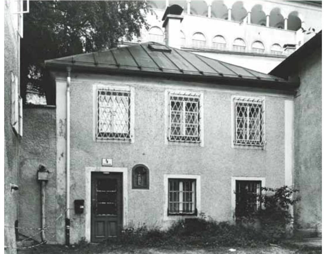
Hauptfassade / Main facade Bierjodlgasse 5 (Herrengasse 4)

Mit der Umnutzung des Gebäudes als Wohnstöckl für den Beichtvater („Caldonazi“) im späten 18. Jahrhundert wurde der Torbogen vermauert und in die neue Gebäudefront integriert. 1912 kaufte ein Fleischhauer das Haus und errichtete im Obergeschoss eine Waschküche, die später als Schank mit Buffet genutzt wurde. In den 1970er Jahren wurde das alte Dach durch ein Zeltdach ersetzt, dessen Form im Rahmen des aktuellen Umbaus bewusst bewahrt worden ist. Mit der Freilegung des frühbarocken feinkörnigen Rieselputzes sowie der zarten Gliederung ist nun die originale Textur wieder hergestellt.