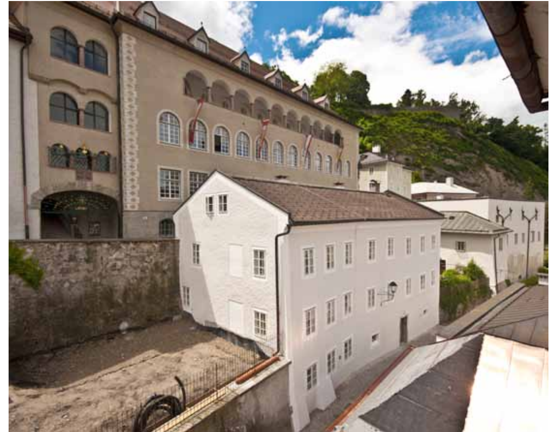
Die frühere Kinderbewahranstalt in der Bierjodlgasse 4 / The former Child Care Institution in Bierjodlgasse 4

Ab 1853 waren die Halleiner Schulschwestern als Erzieherinnen tätig und sicherten so eine katholisch-weibliche Prägung: „Die Kinder stehen nicht nur in beständiger Wart und Pflege von würdigen Schulschwestern“, so der Jahresbericht von 1862, sondern sie werden auch nützlich beschäftigt. „Während eine und die andere Stunde mit zweckmäßig gewählten Kinderspielen ausgefüllt wird, gehört die übrige Zeit der Erziehung und dem Unterrichte an, der alle Rücksicht auf das zarte Alter nimmt und allmählich für die öffentliche Schule vorbereitet.“ Das Haus Bierjodlgasse 4 wurde 1852 vom Verein der Kleinkinderbewahranstalt gekauft. Caroline Auguste spendete zwei Jahre später 4.000 Gulden für die Behebung von Baufällen am Gebäude und auch der Erzbischof und die Stadtgemeinde beteiligten sich an der Sanierung. 1857 wurde die Kleinkinderbewahranstalt in der Steingasse aufgelassen und mit der Einrichtung in der Bierjodlgasse vereinigt, wo sie bis 1924 am Fuß der Festung bestand.