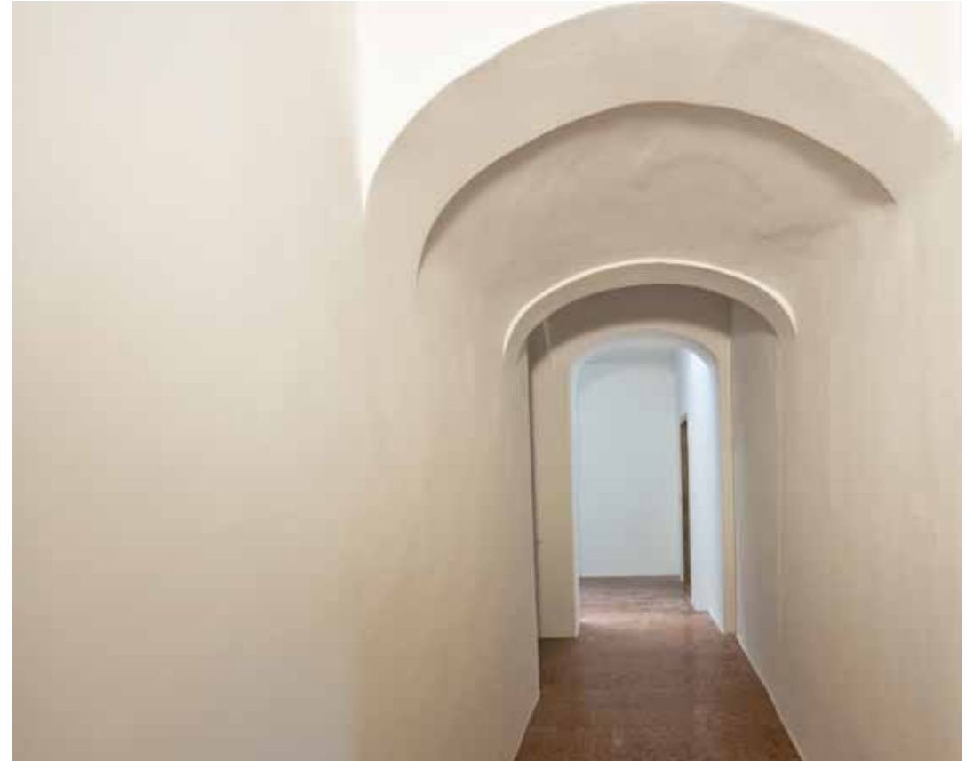
Flur im Stiegenhaus / Hall in the staircase

In 1845, the private, non-profit organisation “Kleinkinder-Bewahr-Verein” (Child Care Institutions Association) was founded under the protectorate of archbishop Friedrich von Schwarzenberg and dowager empress Caroline Auguste, in order to realise the construction of an appropriate facility. Caroline Auguste is considered the founder of the Child Care Institutions in Austria and made an important contribution to the expansion of these childcare facilities by showing great commitment. Archduchess Sophie, princess Schwarzenberg and a number of burghers and burgesses of Salzburg were