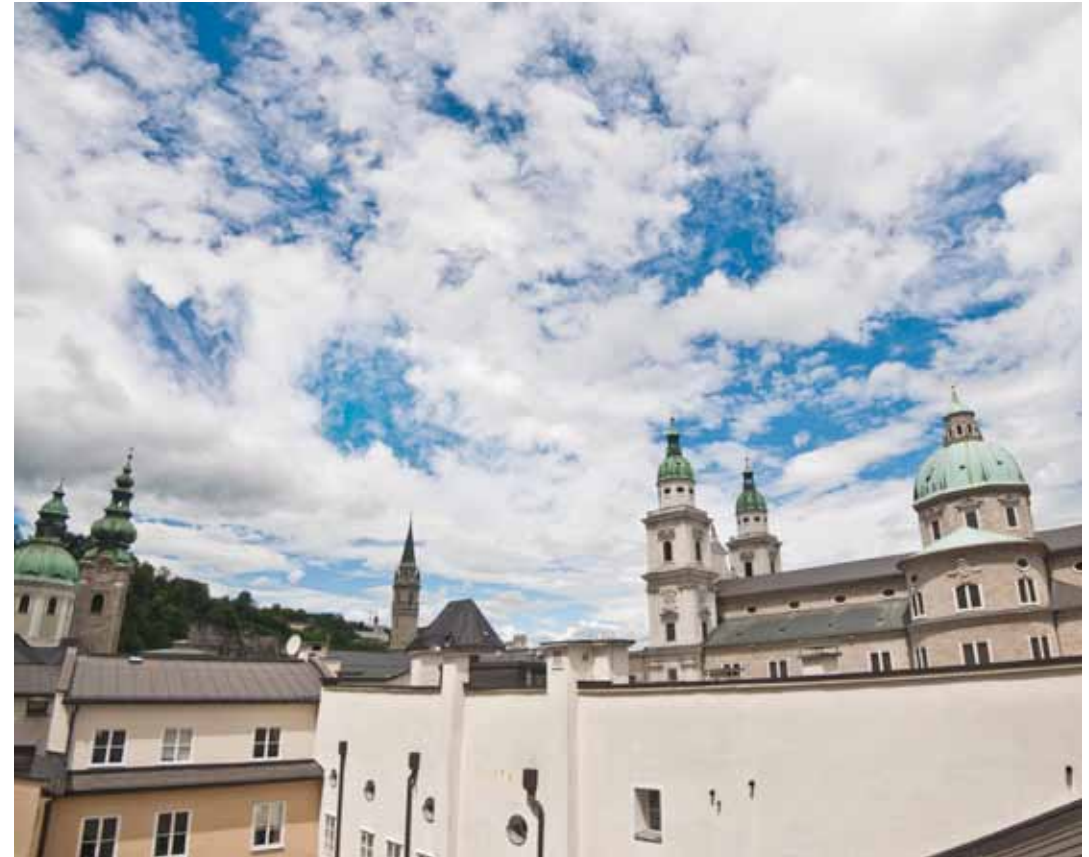
Blick auf den Dombezirk / View to the cathedral area Vom Dachraum von / From the attic of Bierjodlgasse 5 (Herrengasse 4) Stevie Klinar

[translator’s note] Binder: German for “cooper“. Urbarium: medieval register of land ownership.