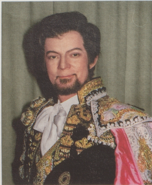
▲ В РОЛИ Эскамильо (опера Жоржа Бизе «Кармен») на сцене Венской государственной оперы. 1980 год.