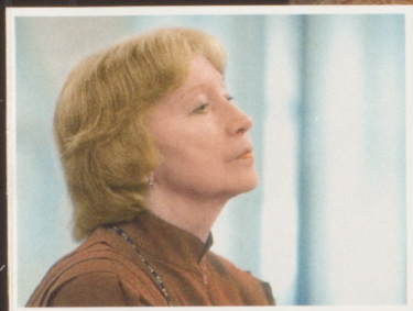
ГАЛИНА УЛАНОВА Незабываемая любовь