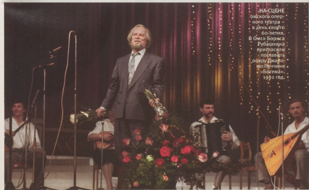
НА СЦЕНЕ омского оперного театра – в день своего 60-летия. В Омск Бориса Рубашкина пригласили поставить оперу Джакомо Пуччини «Богема». 1992 год.