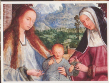
СВЯТАЯ АННА Бабушка Христа