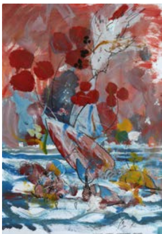
Christian L. Attersee, Wilder Mohn, 2017 Mischtechnik auf Karton, 63 × 44 cm