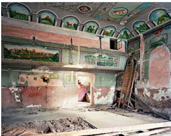
Johanna Diehl, Novoselitsia I, 2013, C-Print, Edition 5 + 1 AP, 126 × 159 cm