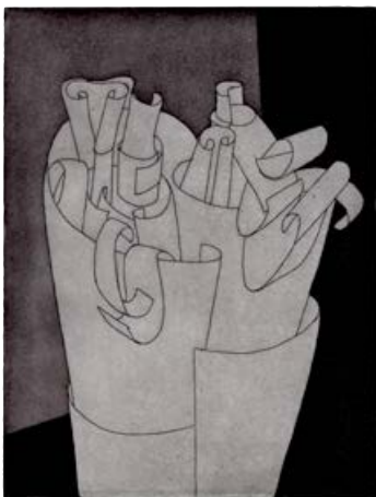
Eva Möseneder, Papier, 2016, Aquatinta, 19,5 × 14,7 cm