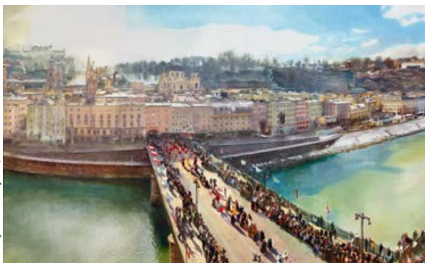
Lois Renner, Wolf Dietrich, 2016, C-print / Diasec, 180 × 295 cm