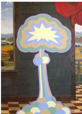
Linas Liandzbergis, gentle family atomic, 2012, Acryl auf Leinwand, 200 × 150cm