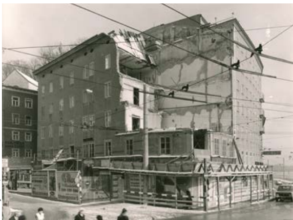
Das Wechsler- oder Lasserhaus am Platzl Nr. 5: Demolierung 1979. Foto: Weber, 1978 (SW-Fotografie)