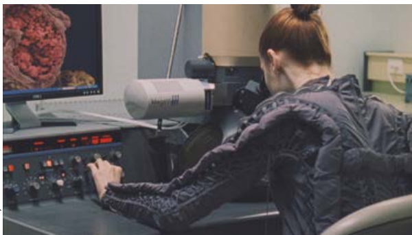
Ursula Mayer, ATOM SPIRIT , 2016/17, 16 mm auf HD, 20 min