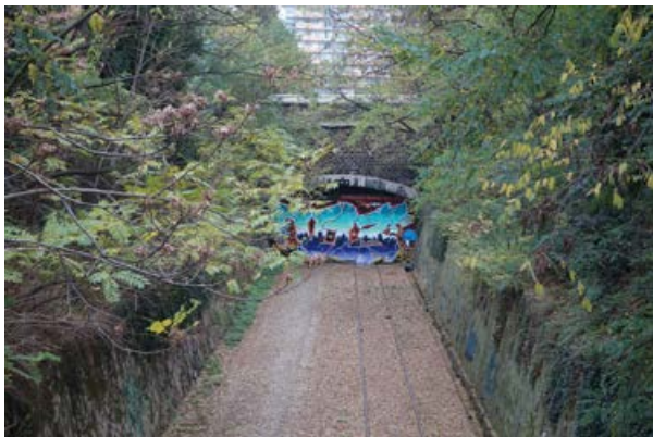
Elisabeth Wörndl, aus der Serie »La Petite Ceinture«, 2016, Farbfotografie