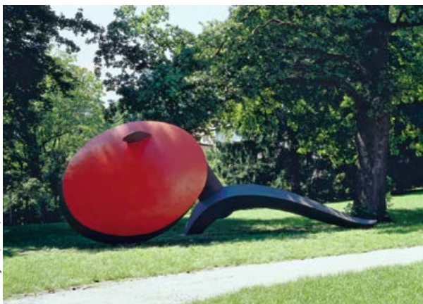
Lun Tichnowski, Des Art et des Lettres IV, 1997

Sammlung Würth, Inv. 5319, © Foto: Julia Schambeck