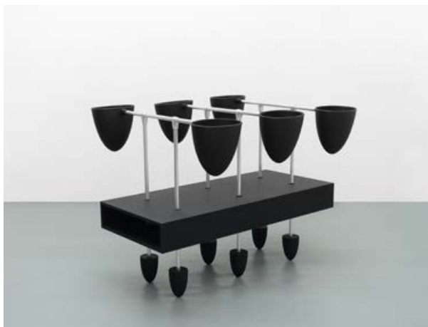
Julie Hayward, »Miss Needy«, 2016, MDF, Holz, Polyester, Softlack, Aluminium 116 × 129 × 154 cm