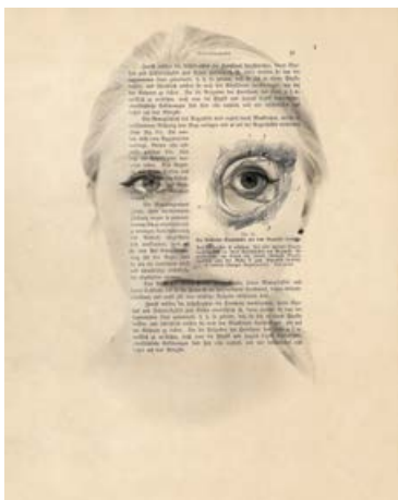
Anne-Marie Reisinger, Sinnesorgane, Fig. 21, 2017