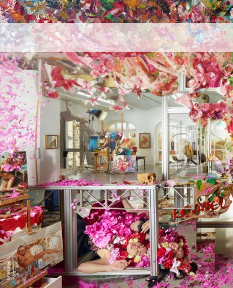
Salzburg Museum: Lois Renner, Heliogabalus, 2017 (Ausschnitt), C-Print / DIASEC, 300 × 450 cm