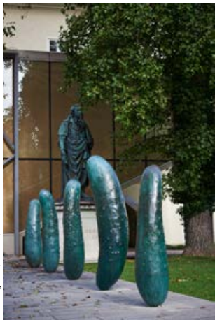
Erwin Wurm, Gurken, 2011

Sammlung Würth, Inv. 14953, Foto © Stefan Zenzmair