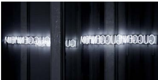
joehlTRAGSEILER, MIEHNEGGUG, 2016, Fotografie