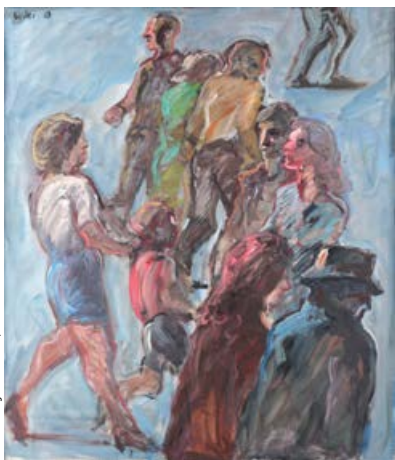
Georg Eisler, Fußgeherzone, 1989, Öl auf Leinwand