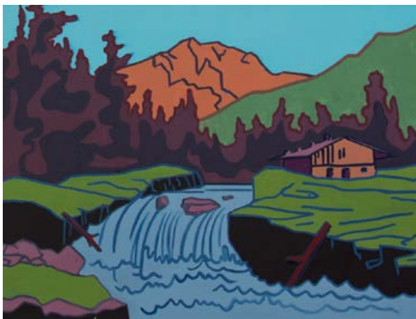
Hubert Schmalix, Sunset, Ausschnitt, 2014, Öl auf Leinwand