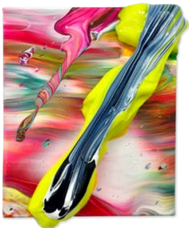
Yago Hortal, SP139, 2017, Acryl auf Leinen, 29 × 23 cm