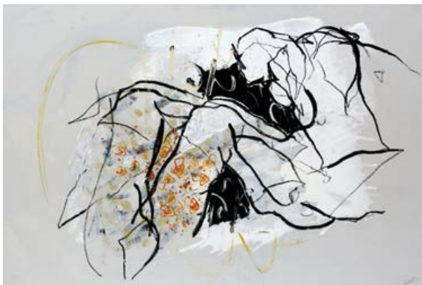
Hannes Mlenek, Atmosphärische Beziehung, 2017, Öl, Acryl/Lwd., 80 × 115 cm