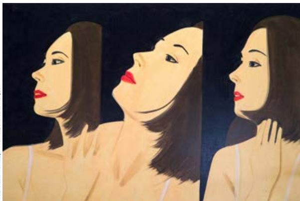
Alex Katz, Laura 8, 2017, Öl auf Leinwand, 152,4 x 228,6 cm