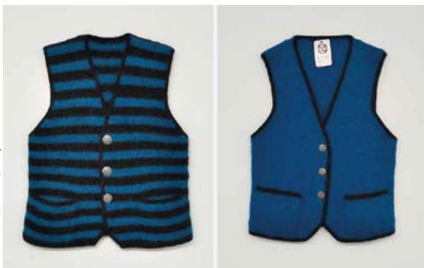
Kathi Hofer, Paris, Tokio, 2016, Gewalkte Schurwolle, Metall